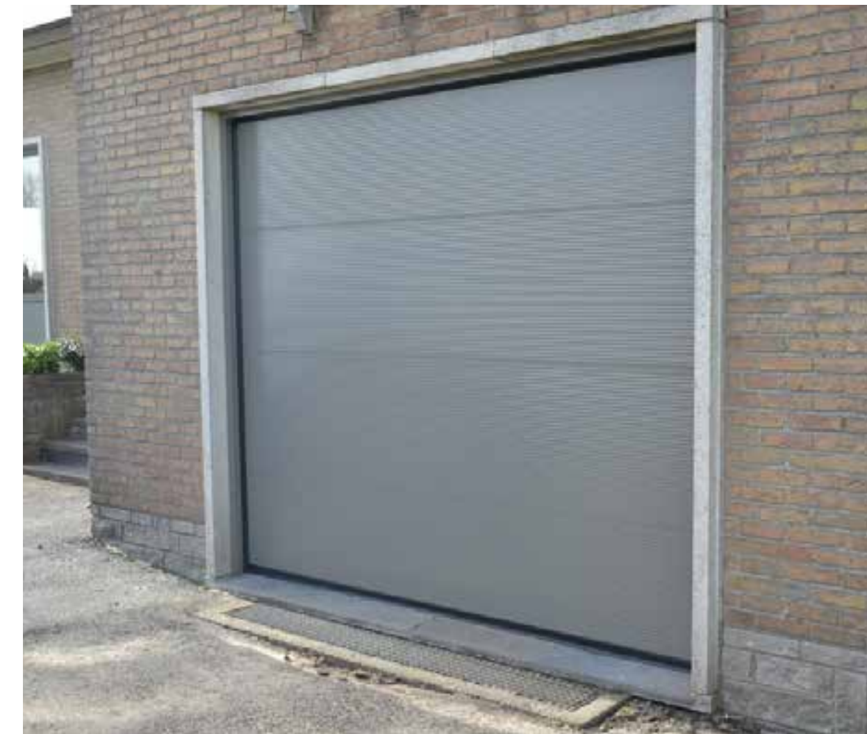
MICRO 8 MM