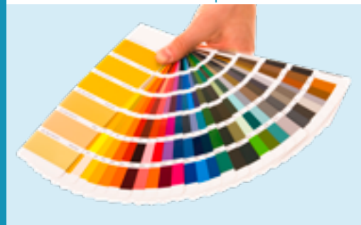
kleur naar keuze